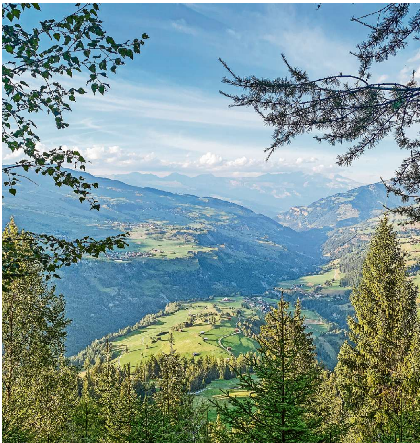
Vista sin ils vitgs dad Uors, Surcasti, Degen, Vella, Morissen e Cumbel en Lumnezia.