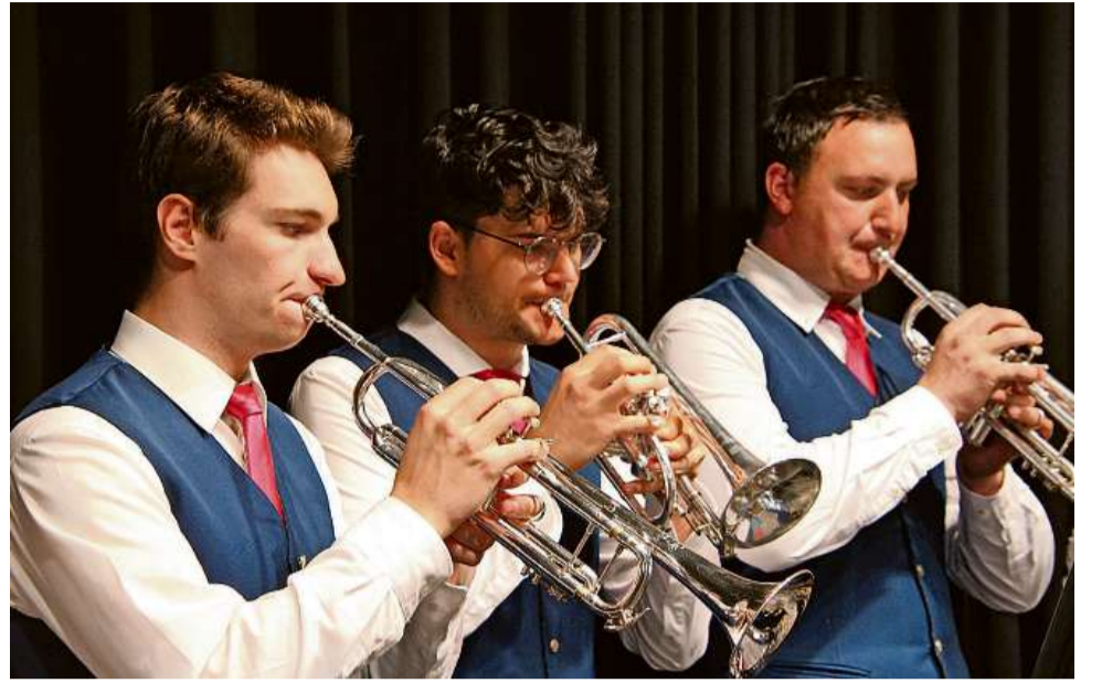
Per la dretga musica tar l'occurrèza ò procuro la Musica instrumentala Salouf Mon Stierva .