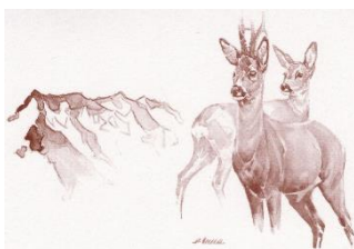
Jägersektion Falknis BKPJV

Samstag, 30. April 2022, 08.00-12.00 Uhr 13.00-16.00 Uhr