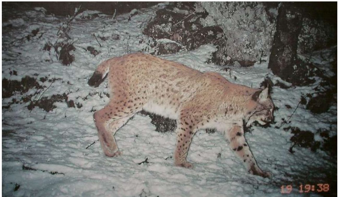
Il luf-tscherver ei turnaus en Surselva avon biebeen 20 onns.

Igl ei stau l'emprema ga suenter 150 onns ch'ins ha constatau ina reproducziun da lufs-tscherver el cantun Grischun. Il territori principal dil luf-tscherver el Grischun ei da sum la Surselva entochen la Tumliasca.