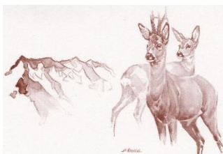
Jägersektion Falknis BKPJV

Samstag, 02. Mai 2020 08.00 - 12.00 Uhr 13.00 - 16.00 Uhr