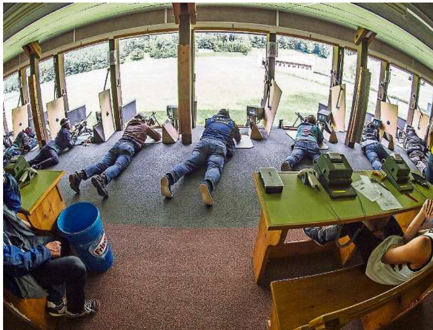
Konzentration: Im Schiessstand Eichrank in Igis wird das Maximalresultat beim diesjährigen Feldschiessen nicht erreicht.

bereits im Vorschiesen an seinem Heimstand. Der einzige Bündner Ma-