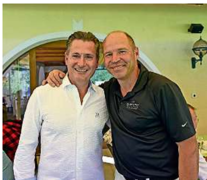
Skistars: Conradin Cathomen (links) und Marc Girardelli.